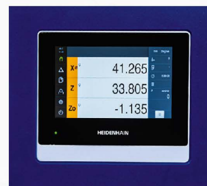
Affichage numérique de position Heidenhain ND7013