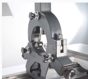
Lunette fixe avec touches à galets Ø 12–150 mm