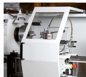
Capot de protection coulissant avec vitre de sécurité