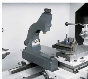
Lunette à suivre avec touches fixes Ø 10–160 mm