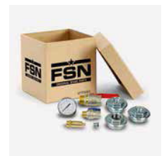
Zubehörset / set d'accessoires