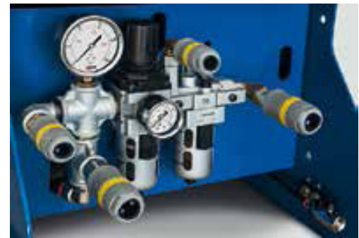
Mit integrierter Wartungseinheit Avec unité de maintenanc eintégr é