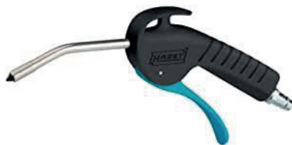
Blasrohr und Welle aus eloxiertem Stahl Tube de soufflage et arbre en acier anodisé