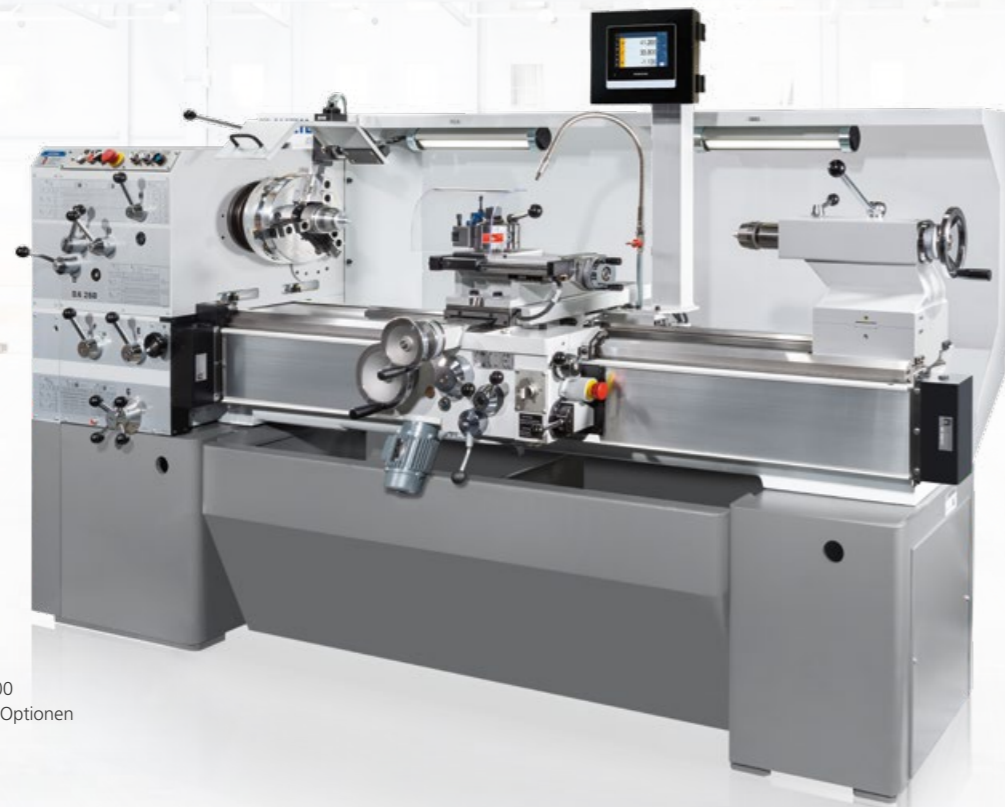
Modell DA 260 x 1.500 Abbildung beinhaltet Optionen