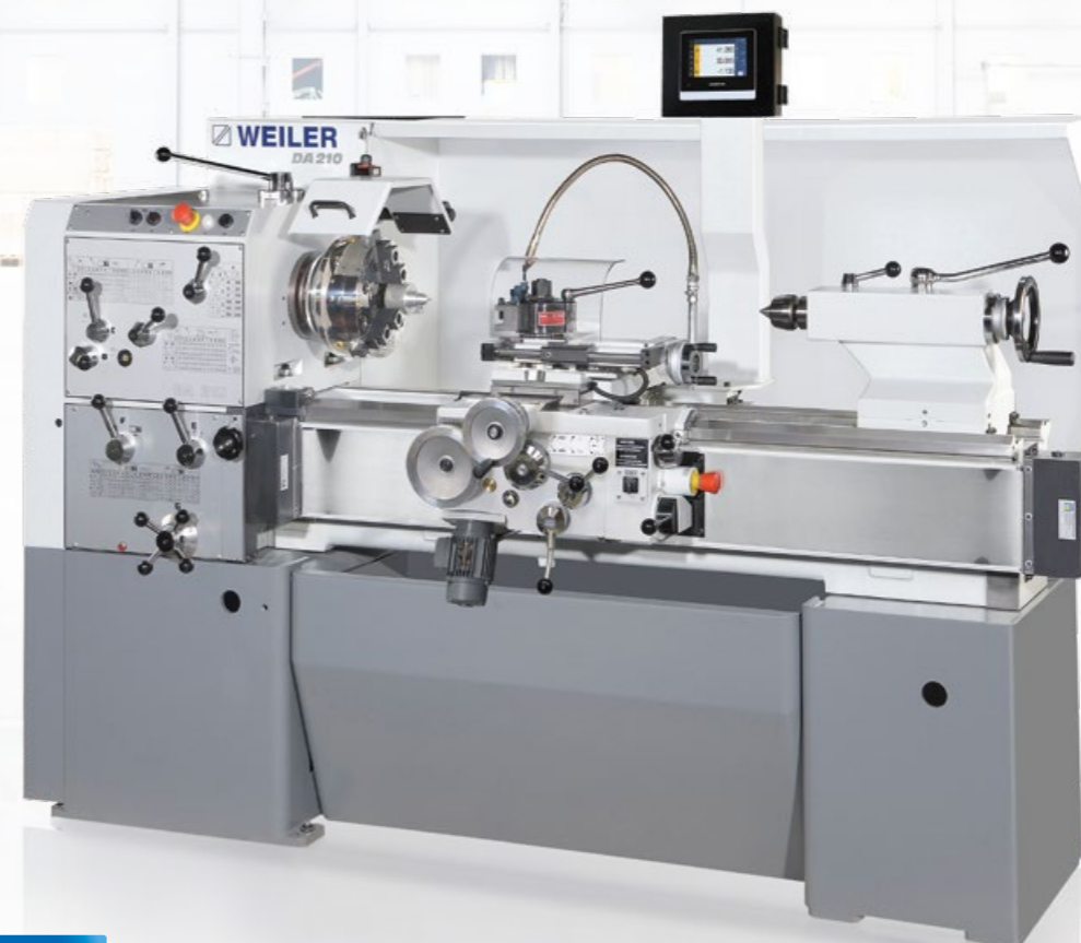
Abbildung beinhaltet Optionen