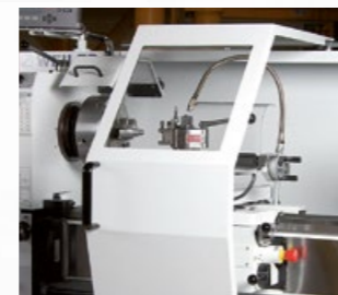
Verfahrbare, umfassende Spänespritzschutzhäube mit Sichtfenster