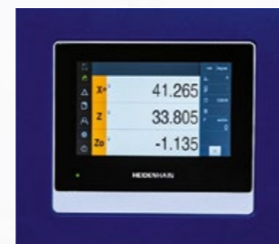
Numerische Positionsanzeige Heidenhain ND7013