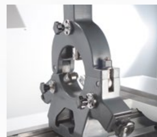
Feststehende Lünette mit Rollenbacken Ø 12–150 mm