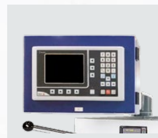
Digitale Positionsanzeige Type Fagor 40i TS für 3 Achsen und V-Konstant-Funktion