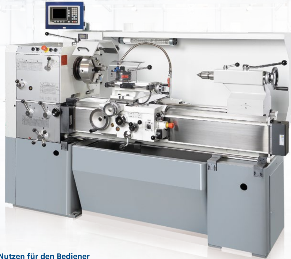
Modell DA 260 AC x 1000 Abbildung beinhaltet Optionen