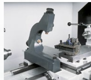
Mitlaufende Lünette mit Gleitbacken Ø 10–160 mm