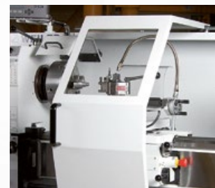
Verfahrbare, umfassende Spänespritzschutzhaube mit Sichtfenster